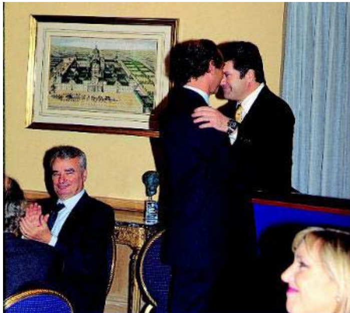
El homenajeado, Consejero Delegado de Telefónica, recibe un abrazo de su presidente

Acto seguido, tuvo lugar una cena de hermandad entre los familiares, amigos y compañeros del homenajeado.