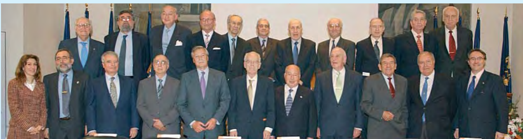
Los ingenieros que celebraban sus cincuenta años de profesión con los intervinientes en el acto del 75º aniversario de la AEIT.

El acto finalizó con un cóctel en el que los más de 200 asistentes pudieron charlar y compartir experiencias.