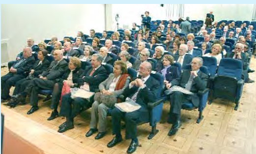
Asistentes al acto.