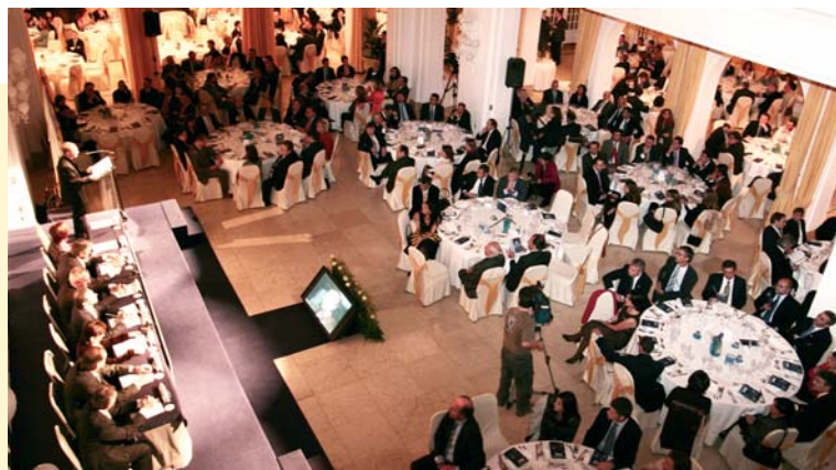
La Noite Galega das Telecomunicacións e da Sociedade da Información congregó a más de 300 profesionales del sector TIC gallego.

Solicitó a los representantes de la Administración que se vuelquen en el desarrollo de este sector y que la Xunta habilite los recursos necesarios para asentarlo y expansionarlo, "que pase de las palabras a los hechos, para lo que puede contar", dijo, "con el apoyo incondicional de todos los ingenieros de telecomunicación de Galicia representados por el COETG/AETG".