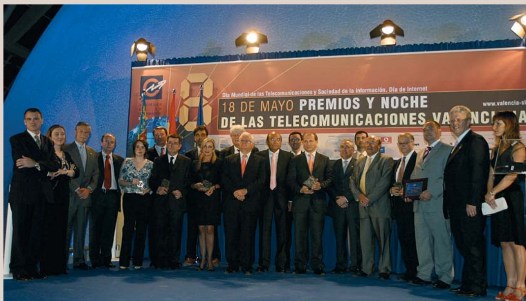
Premiados y patrocinadores de la VIII Noche de las Telecomunicaciones en Valencia

Como importante novedad, destacó la retransmisión en directo, por primera vez este año, de la gala de entrega de premios, a través de Internet, gracias a la colaboración de la empresa valenciana iDifusión.