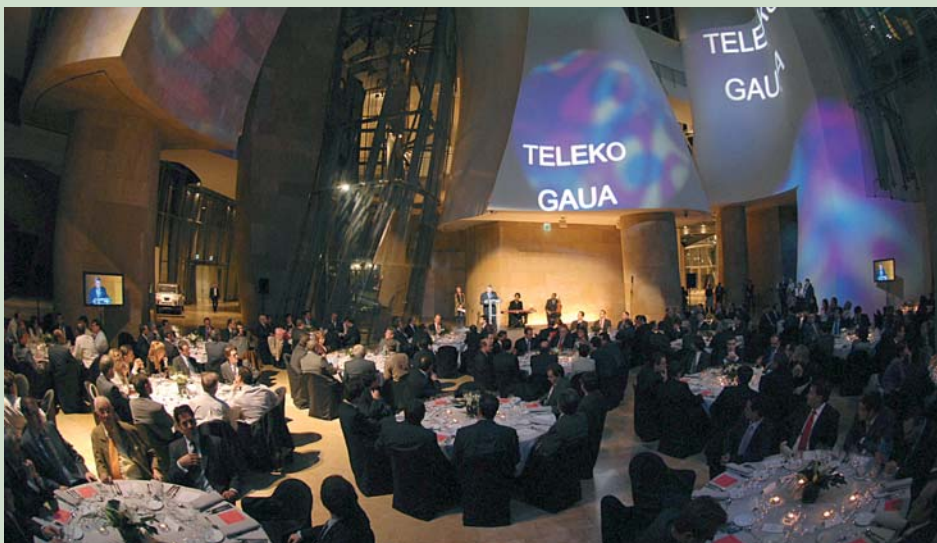
El Decano, D. Juan Luis Ordiales Basterretxe inaugura la Teleko Gaua 2006

Alcalde, Iñaki Azkuna . Durante la Cena destacaron las intervenciones de las autoridades. Al concluir los postres se procedió a la entrega de los "I Premios de las Telecomunicaciones" convocados en esta edición inaugural en sus cuatro categorías: a la Innovación, al personaje TIC, a la mejor aplicación TIC y a la Telecomunicación.