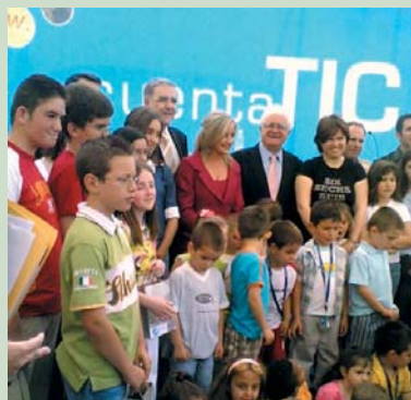
Premios CuentaTIC y EscenariosTIC en el Día Mundial en Valencia

Ese día se hizo igualmente entrega de los "Premios del Concurso Cuenta TIC", galardones que concede el COITCV a alumnos de Secundaria.