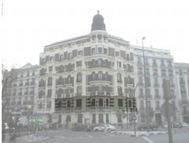
SALA DE REUNIONES DEL COIT/AEIT