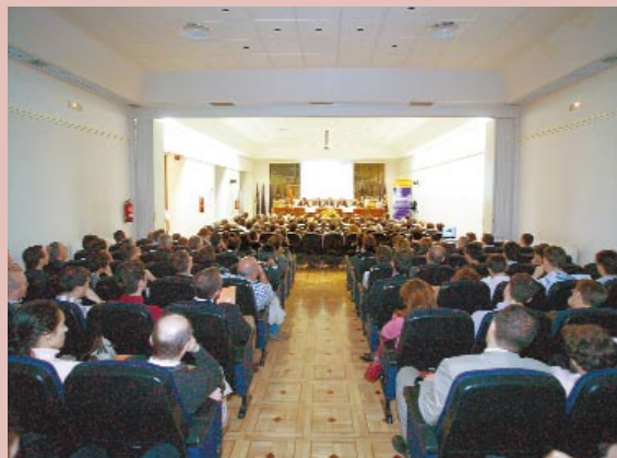
VISTA DEL SALÓN DE ACTOS DEL IIE