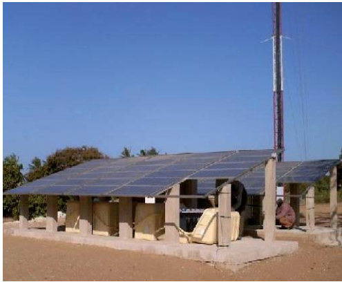
Figura 3: Estación base alimentada mediante paneles de energía solar.

Éstos son sólo algunos ejemplos de las múltiples soluciones que permiten mejorar la eficiencia energética de la red de telecomunicaciones y que pueden contribuir a que nuestra compañía sea asociada al concepto de “marca verde”.