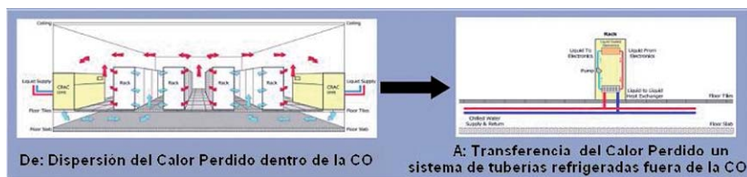
Figura 1: Esquema del funcionamiento de las soluciones de refrigeración modular.

para vivir (Edelman, goodpurpose study, 2007)