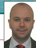
Jaime Pozuelo-Monfort The Multidisciplinary European http://j.pozuelo-monfort.com