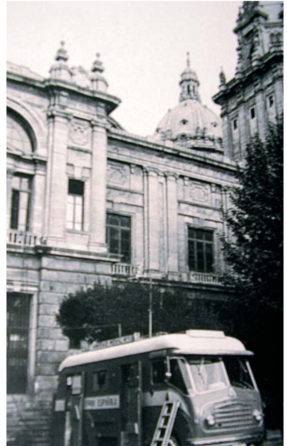
Una de las primeras unidades móviles de televisión.

“Las dificultades que plantean las condiciones climatológicas del paraje en que se ha realizado este proyecto hacen necesaria la urgente ejecución del mismo (...)”. Dichas dificultades justificaban la autorización para contratar, sin las solemnidades de subasta, la “segunda fase del edificio”, por un importe de 1.389.925,03 pesetas. Nuevamente, un decreto de 17 de abril de 1959 explicaba, debido a las “dificultades que plantean las condiciones climatológicas del paraje (...)”, la necesidad de construcción de un edificio-torre para la instalación de antena y parábolas de televisión en Navacerrada por un importe de 3.765.031,05 pesetas. Una Ley, de 11 de mayo de 1959, concedía tres suplementos de crédito por un importe total de 21.000.000 de pesetas, como consecuencia de que “El funcionamiento en cadena de las emisoras de televisión en Madrid (Navacerrada), Barcelona y Zaragoza, previsto para el año en curso (...) que, al recargarse con nuevos y más intensos gastos, resultan insufi-