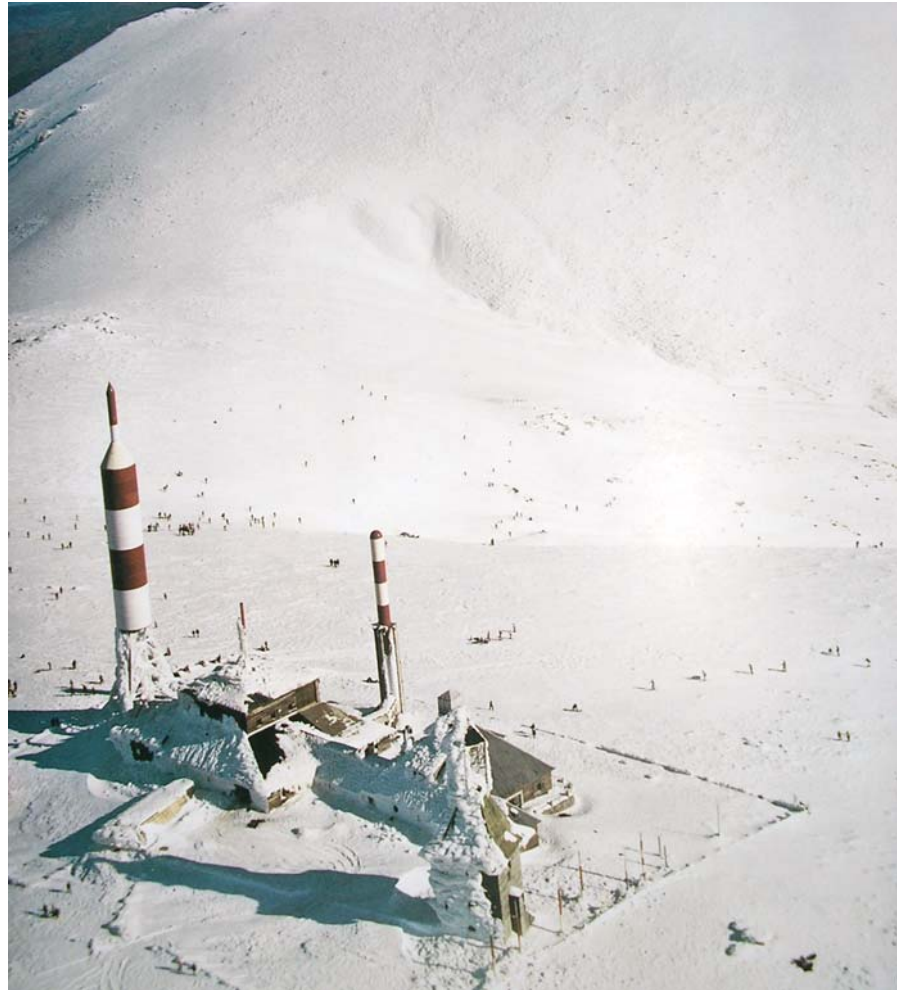
Antena de televisión en la Bola del Mundo.

En el Decreto de 3 de octubre de 1957, sobre fabricación del receptor nacional, se decía que el pliego de condiciones se publicaría en el plazo máximo de cuatro meses. Hay que hacer constar que dicho decreto, de 3 de octubre, se publicó en el Boletín Oficial del Estado (BOE) del 29 de noviembre de ese año. Y, efectivamente, en el BOE del día 10 de marzo de 1958 aparecía una orden de fecha 6 de marzo en la que se publicaba el pliego de condiciones en cuestión, dentro del plazo establecido, si se