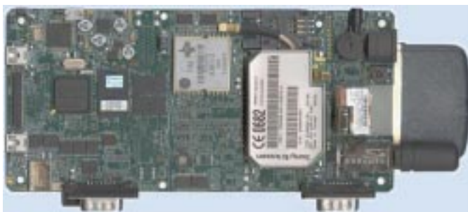
Placa embebida MIP6 (161 x 80 mm)

Antes de que se desarrollase el estándar de conexión USB (Universal Serial Bus), la instalación de los periféricos era tarea a veces ardua. Hay dispositivos que necesitan una conexión de alta velocidad, como pueden ser capturadoras de vídeo, discos duros, etc., mientras que otros pueden funcionar con conexiones lentas, como ratones, teclados, disqueteras, etc. Antes de aparecer el USB, si se quería conectar un dispositivo externo de gran velocidad, sólo se podía hacer a través de una tarjeta SCSI, que es un sistema caro, complejo y poco flexible.