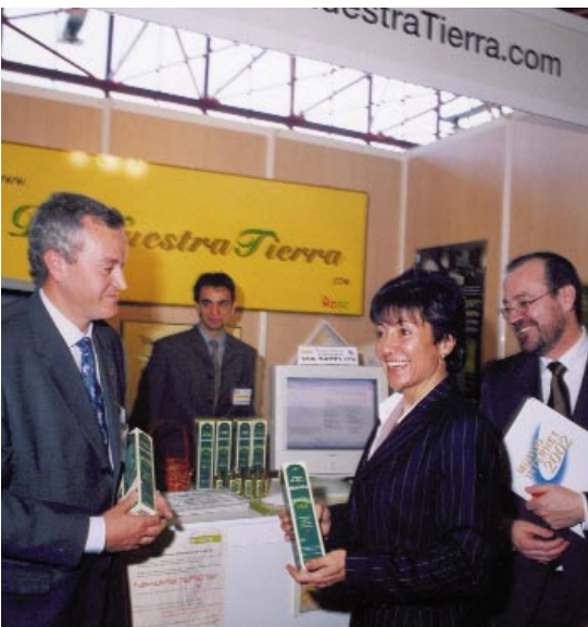
Visita de la Ministra de Ciencia y Tecnología a la Feria Mundo Internet 2002 junto al autor del artículo

continúa debiendo sus actuales siglas. En aquel año de inicio fueron 40 expositores, que apenas ocupaban 500 metros del Palacio de Exposiciones del Retiro. Desde 1961, SIMO ha acudido todos los años a la cita con las nuevas tecnologías, evolucionando y especializándose progresivamente en la informática y las comunicaciones.