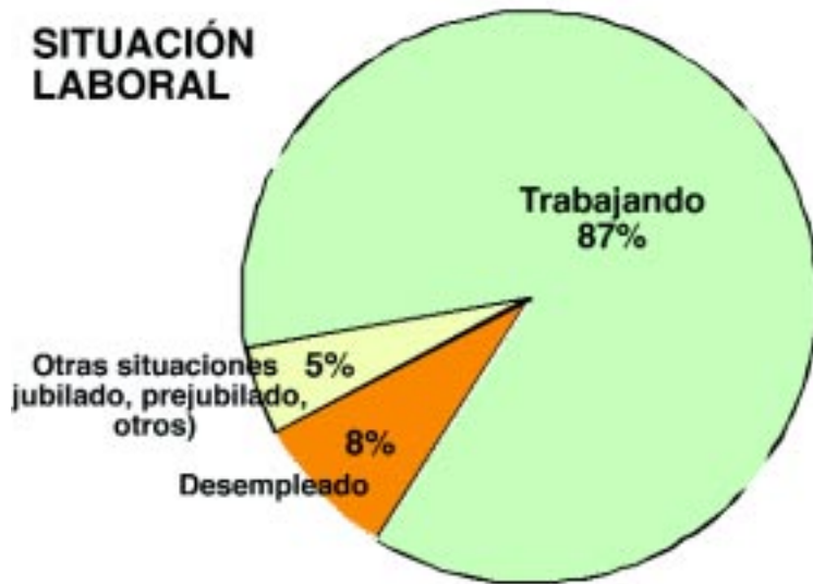
Gráfico n° 1