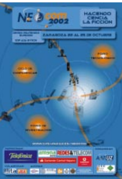
Cartel Oficial de NEOcom 2002: Haciendo Ciencia la Ficción

E l 8 de febrero de 1828, en la localidad francesa de Nantes, nace un soñador. Su mente prodigiosa le hizo soñar con dar la vuelta al mundo, con bajar hasta las profundidades de la tierra, viajar en máquinas que parecían peces, incluso soñó con viajar hasta la luna, cuando todo el mundo se contentaba con mirarla. Después de estudiar Derecho, ser agente de bolsa, incluso participar de la política de su tiempo, encontró en el sueño de su vida la razón por la que sería recordado. Murió el 24 de marzo de 1905.