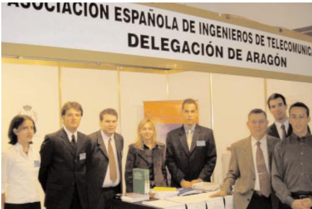
Miembros de la organización de NEOcom 2002 junto con representantes de la junta directiva en el stand de la Delegación en Aragón del COIT/AEIT.

pia Universidad de Zaragoza. En esta edición, es destacable el patrocinio principal por parte del grupo Telefónica junto con el resto de patrocinadores del evento, como fueron Amena, Vodafone, Santander Central Hispano y Redes&Telecom. A los que hay que añadir las empresas colaboradoras de NEOcom, como el Instituto Tecnológico de Aragón (ITA) y PCCity.