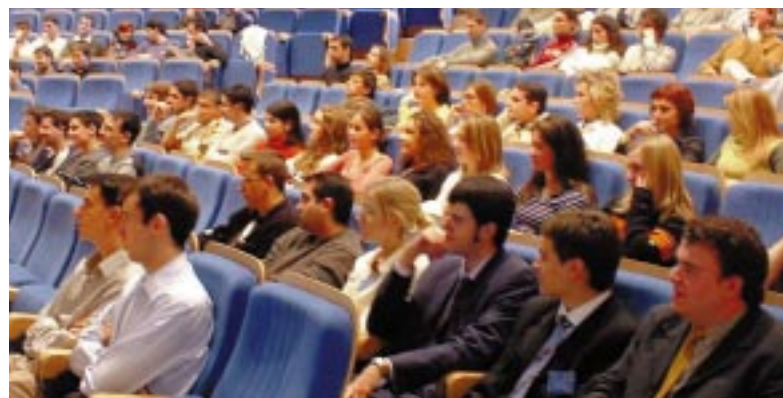
Público Asistente al Ciclo de Conferencias