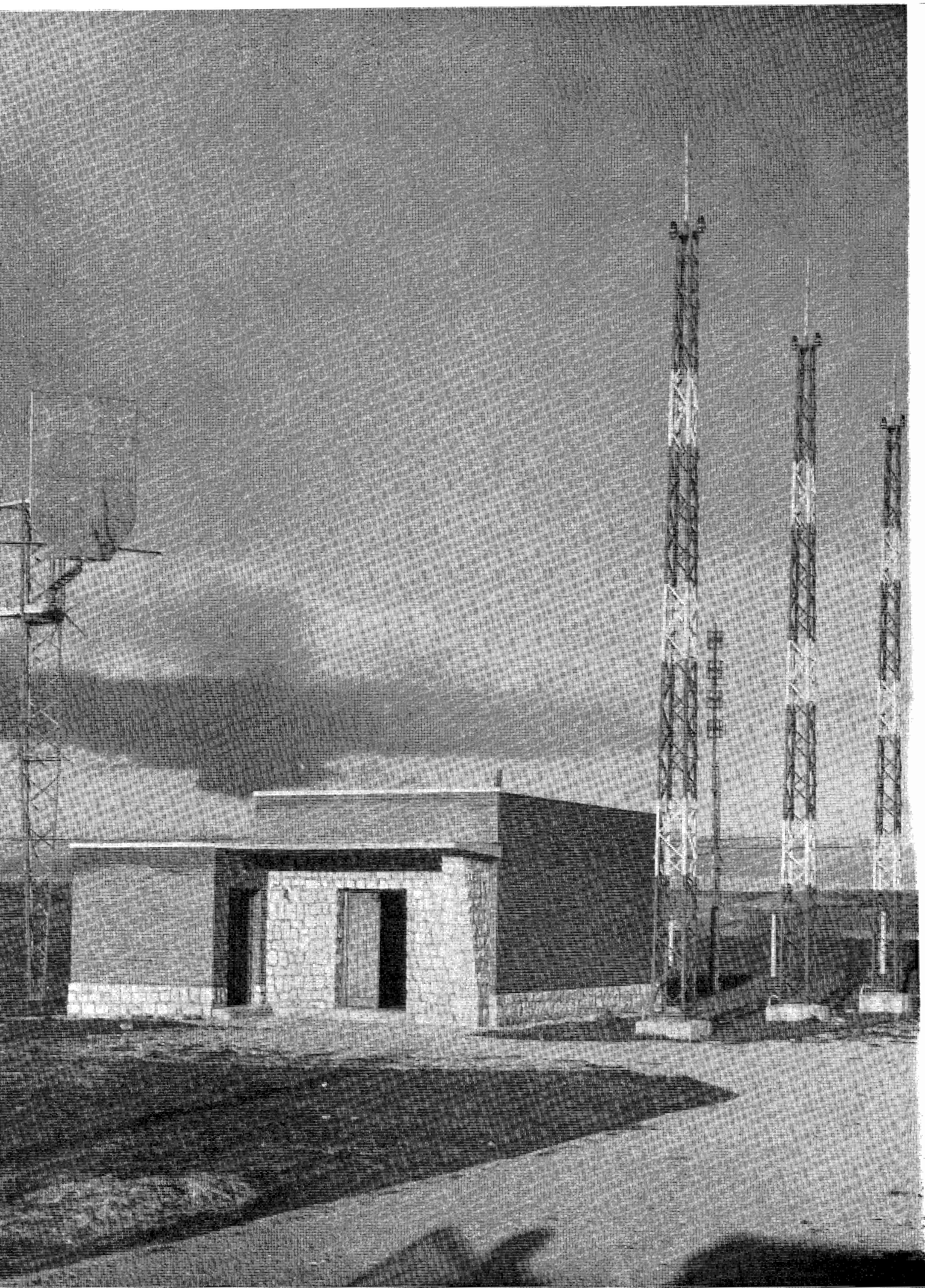
Centro de recepción de V. H. F. y U. H. F. con reflector para enlace hertziano.